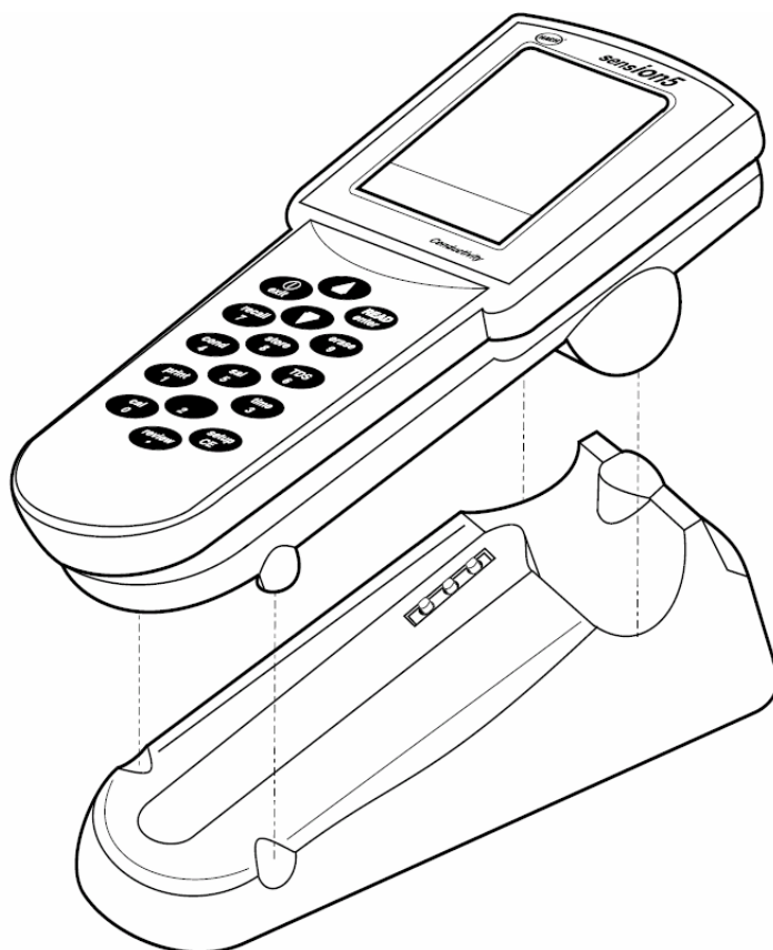
图 5 电源座